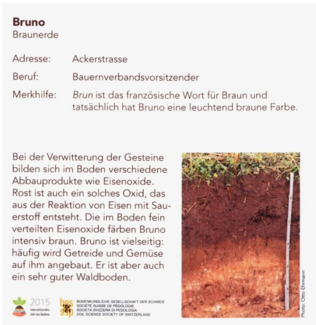
Abb. 2: Zusatzinformationen zum Bodentyp (Rückseite Magnetquadrat)

Nach einer Einführung ins Thema Boden werden die Magnetquadrate an Schülergruppen verteilt. Jede Schülergruppe stellt den erhaltenen Bodentyp nach eigener Recherche kurz den Mitschülern vor. Das Quadrat wird an der Stelle in der Landschaft angebracht, an welcher der Bodentyp vermutet wird.